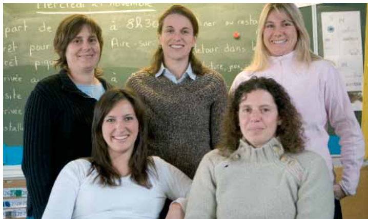
Les enseignantes de l'École Primaire

en identifiant les élèves à besoin éducatifs particuliers.