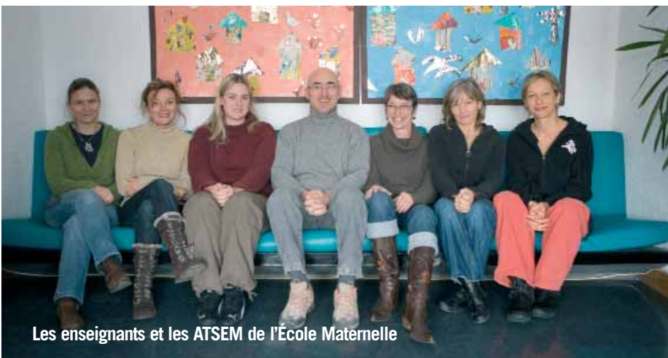
Les enseignantes et les ATSEM de l'École Maternelle

Bonne année scolaire à tous, grands et petits.